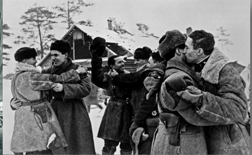
-ВЕЛИКАЯ ПОВЕДА ОДЕРЖАНА СОВЕТСКИМИ ВОЙСКАМИ ПОД ЛЕНИНГРАДОМ:

18 января 1943 года стал днем, когда удалось прорвать кольцо блокады.