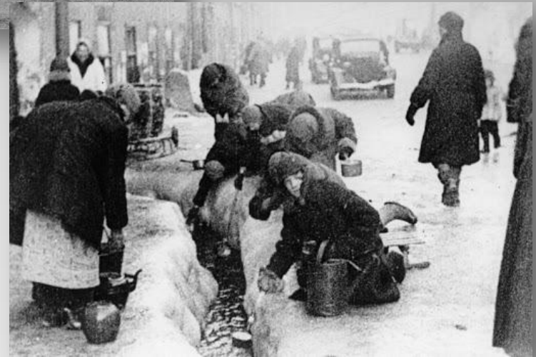
Воду брали из реки Невы